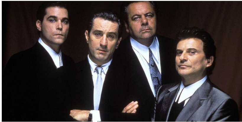
Godfellas (Scorsese, 1990)