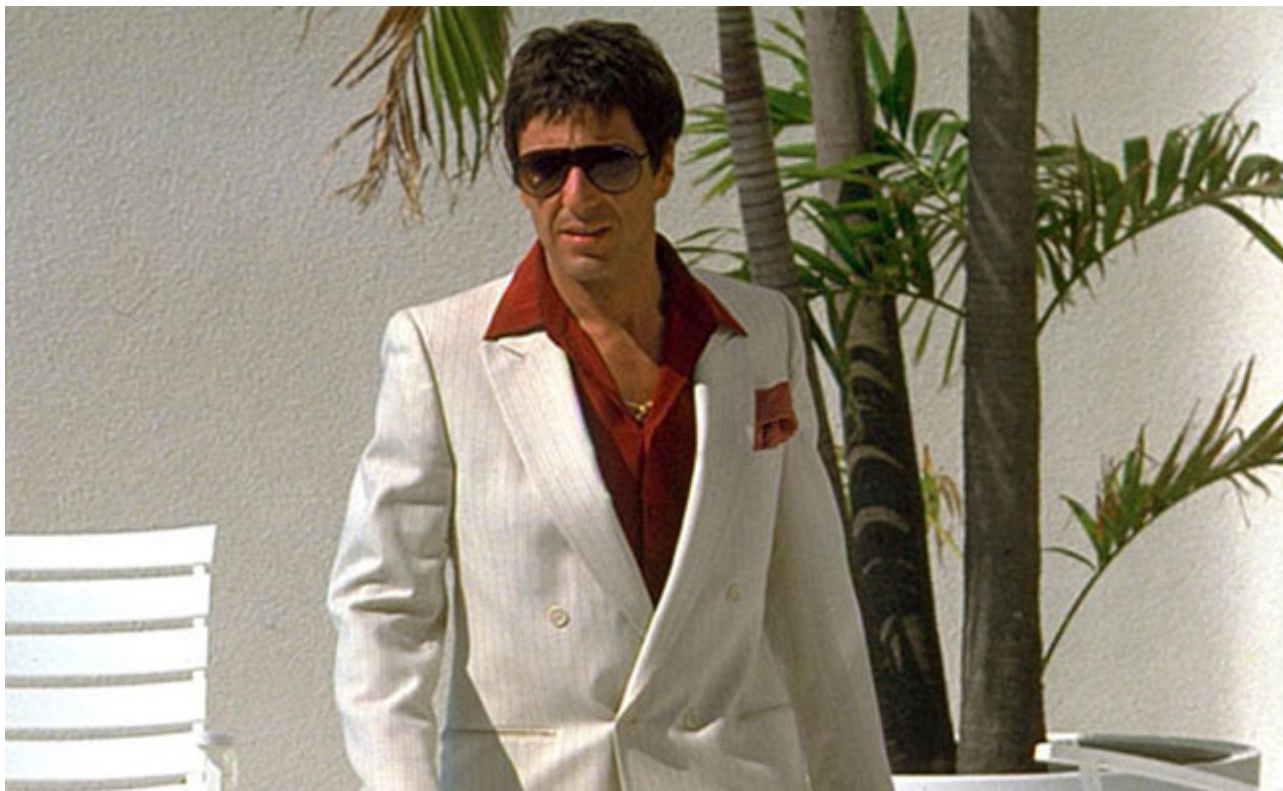
Illustrazione 3: Al Pacino in Scarface. L'evoluzione dello status di Tony Montana si riflette anche nell'abbigliamento, dalle camicie sgargianti ai completi bianchi e costosi