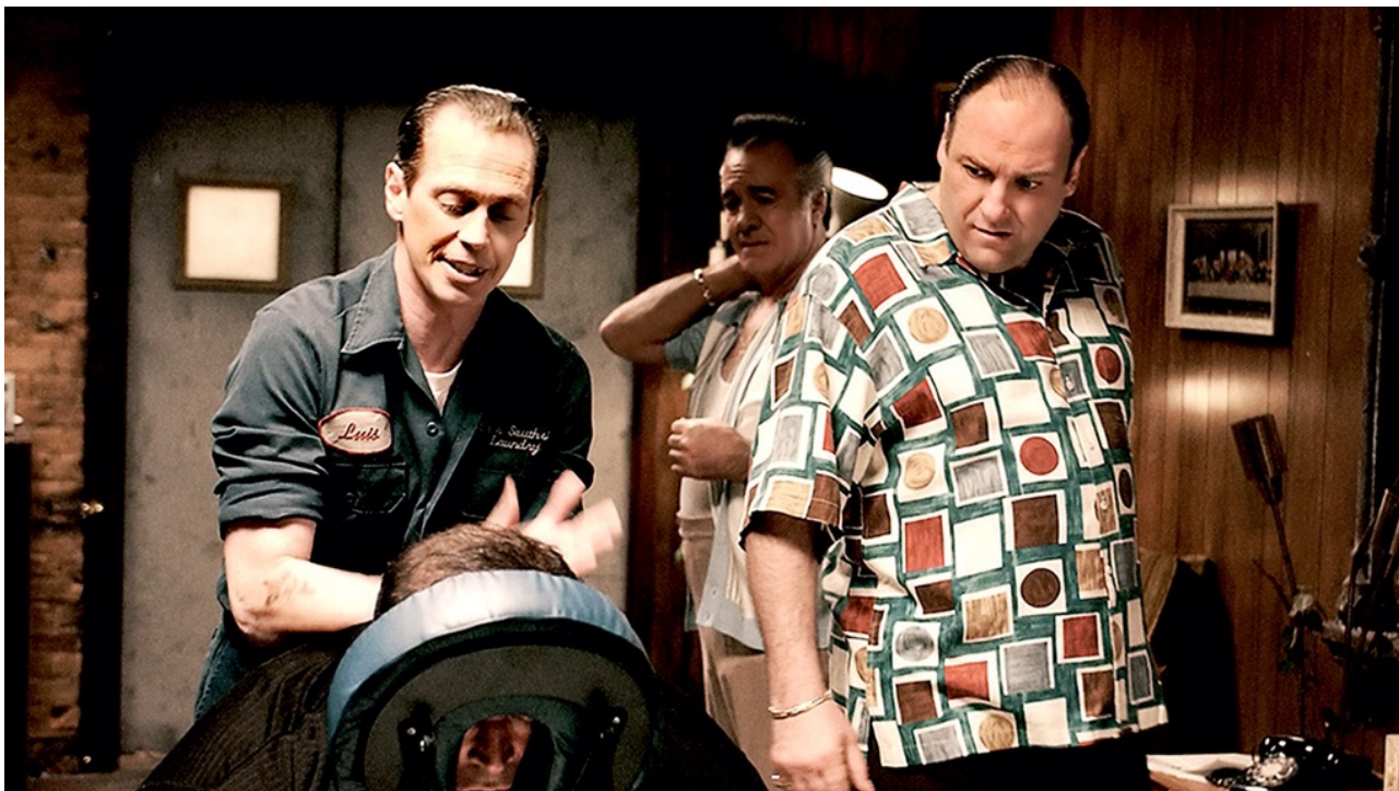
Illustrazione 2: James Gandolfini (a destra) nei panni di Tony Soprano in The Sopranos (1999)

si possono individuare riferimenti al film culto di De Palma in particolare nell'abbigliamento di Tony Soprano (James Gandolfini)