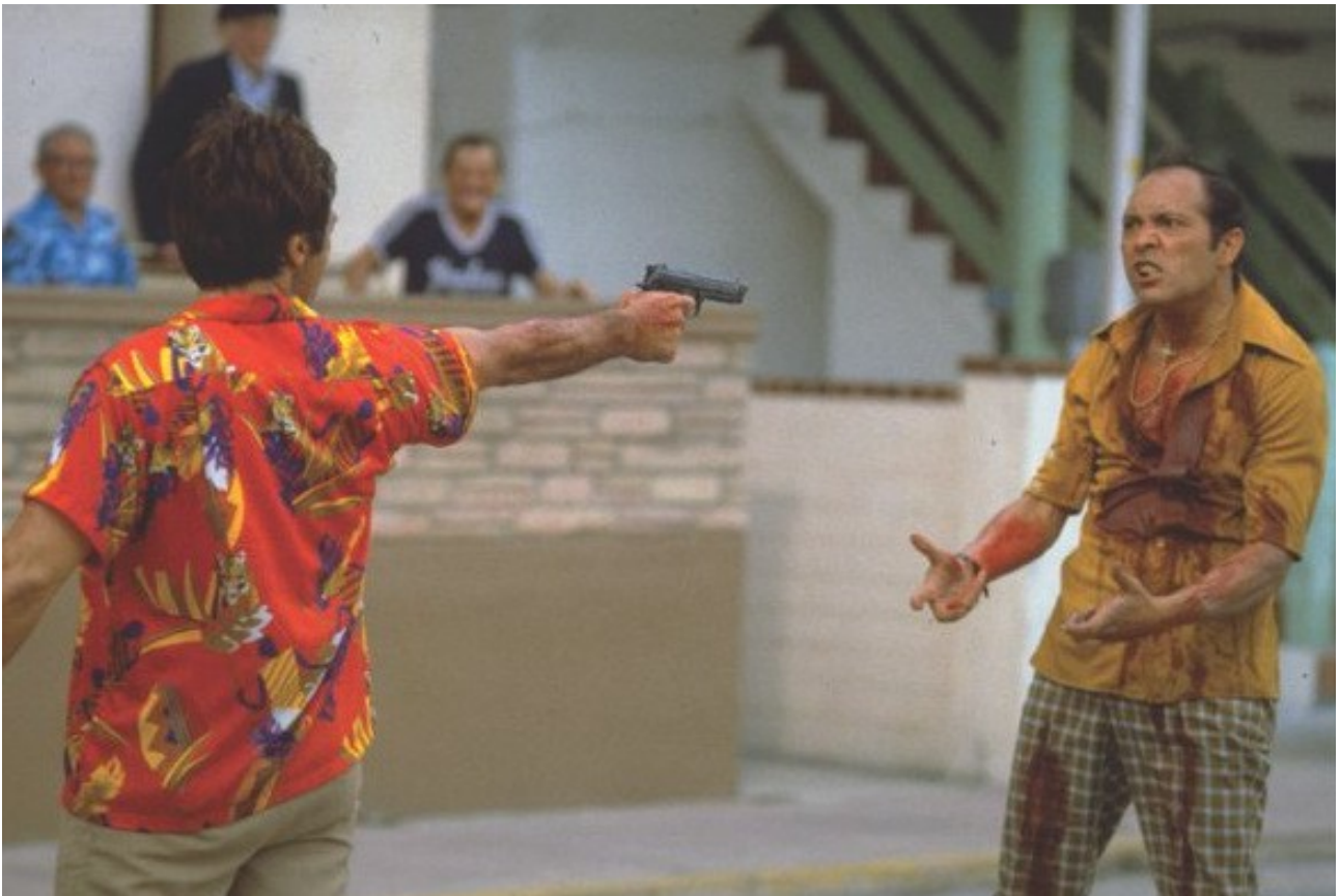
Illustrazione 1: Al Pacino (a sinistra) in Scarface

Inizialmente la provenienza caraibica di Tony e la mancanza di denaro si riflettono in parte nella predilezione per le camicie a maniche corte e larghe dai colori sgargianti. Oltre che a caratterizzarlo socialmente questo abbigliamento contribuisce a definire il carattere forte e carismatico del personaggio, catalizzando su di lui l'attenzione dello spettatore.