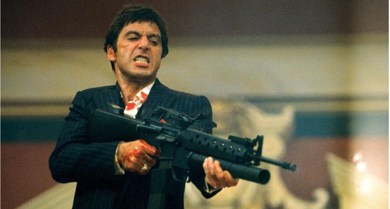
Illustrazione 4: Al Pacino in Scarface (De Palma, 1982)

Nonostante i costumi di Scarface siano rappresentativi del loro contesto storico, hanno ancora dei richiami forti ai modelli dei gangster di sessant'anni prima: nel film Tony afferma di aver imparato a parlare inglese dai film di Jimmy Cagney e Humphrey Bogart, e questa eredità appare chiara nella scena cult della sparatoria finale in cui indossa un gessato blu profondo, vestito a tre pezzi simile ai suoi maestri dello stile gangster degli anni '30 / '40.