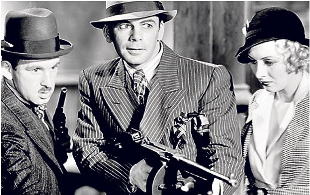
Paul Muni in Scarface (Hawks, 1932)