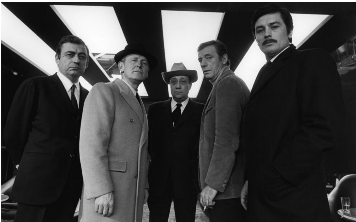
Le cercle rouge (Jean-Pierre Melville, 1970)

L'ispirazione determinante venne comunque dalla volontà di omaggiare i film di gangster francesi da cui la Heimann trasse l'immagine del gangster vestito di scuro, in giacca e cravatta.