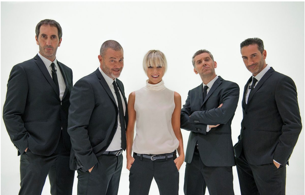
I reporter di Le Iene (2017)