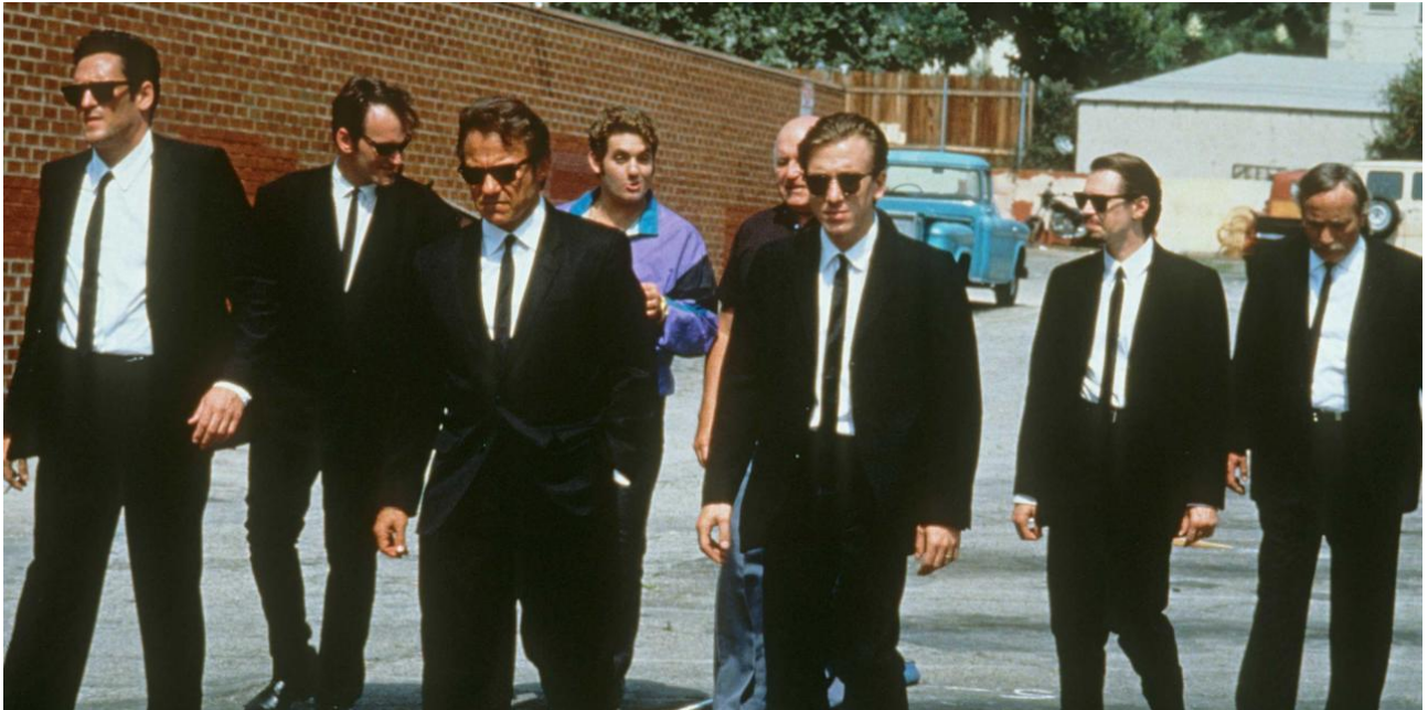
Le iene (Tarantino, 1992)

Il film d'esordio di Tarantino oltre a preannunciare la folgorante carriera del regista americano è diventato film di culto soprattutto grazie al lavoro eccezionale svolto insieme alla costumista Betsy Heimann sui costumi dei personaggi: l'idea originaria di Tarantino era di omaggiare i film della nouvelle vague francese, inoltre voleva che i rapinatori vestissero dei costumi anonimi che non li rendessero riconoscibili, identificabili. Le giacche scure con la camicia bianca e la cravatta nera rendevano questa idea di anonimato alla perfezione. C'erano comunque anche ragioni narrative, la Heimann precisa che l'idea è che i protagonisti fossero tutti appena usciti di prigione e che quindi avessero poche disponibilità di vestiario: le istruzioni di vestirsi in giacca nera e camicia bianca derivano dal fatto che sono abiti che chiunque avrebbe potuto procurarsi con poca spesa in un qualsiasi negozio di abiti usati.