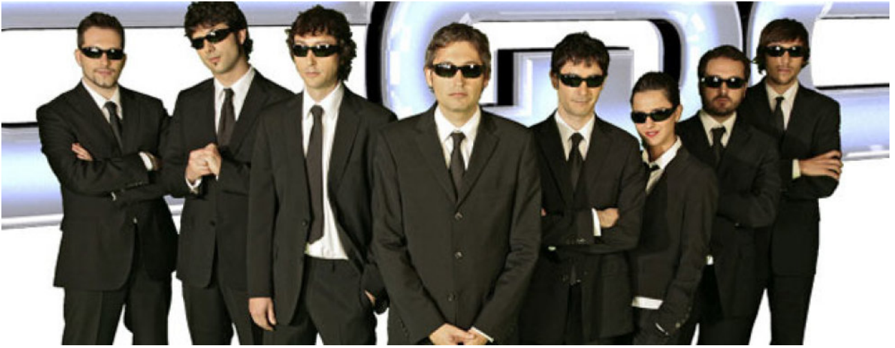
I reporter di Caiga quien caiga (1995)